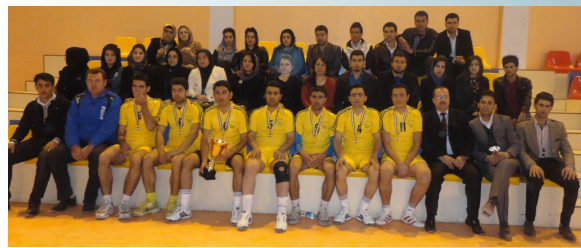
جاریكى دیکەش ئاداب دەبیته پائەوانى خولیکى زانکوی سۆران ۱۱